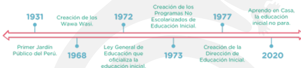
Hitos de la Educación Inicial

Nota: La figura muestra los cambios de la Educación Inicial entre los años 1931 a 2020. Adaptado de MINEDU 2023.